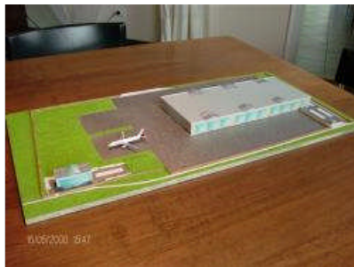
Das Modell des Flugzeugwartungszentrums